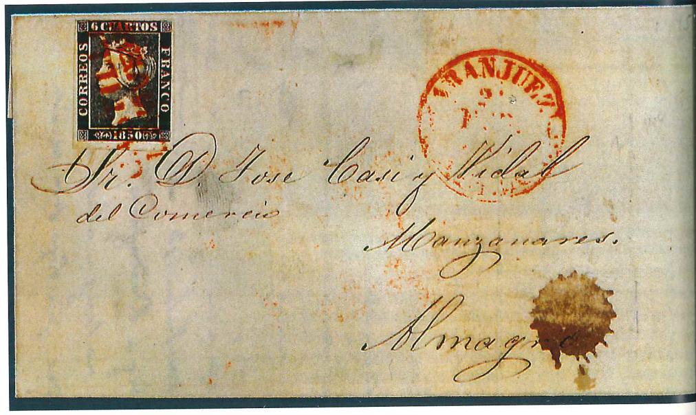
Carta con el primer sello de España, circulada en 1850 de Aranjuez a Almagro. Cuenta con matasellos prefilatélico y fechador de Aranjuez.

insignificante. También demostró que era mucho mejor calcular el coste según el peso en lugar de medirlo por distancias. Propuso una tarifa única de 1 penique para las cartas de media onza repartidas en Inglaterra; el pago adelantado podría realizarse utilizando una etiqueta o un papel especial diseñado a tal efecto. Todo ello fue aprobado por las autoridades británicas. En 1839 se organizó un concurso de diseños para las etiquetas adhesivas y de papel sellado. Aunque se presentaron más de 2.600 participantes, ninguno de los diseños resultó apropiado. Tuvo que ser el propio Rowland Hill quien lo diseñara, contando para ello con la ayuda de los impresores Perkins, Bacon y Petch. Pero como la demanda pública de un franqueo uniforme fue tan desmesurada, el 10 de enero de 1840 se tuvieron que introducir nuevas tasas. Finalmente, el 6 de mayo de 1840 salieron a la venta los sobres sellados diseñados por William Mulready y los famosos sellos de 1 penique. El día 2 peniques se emitió el 8 de mayo. Había nacido el sello