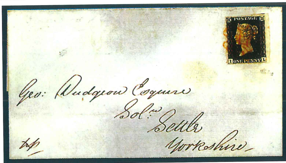
Carta con el primer sello del mundo, circulada en 1840 de Milnthorpe a Settle (Yorkshire). Está matasellada con la cruz de Malta.

población de donde partía el envío. Posteriormente se introdujeron los «fechadores», unos elementos muy buscados por los coleccionistas de prefilatelia. Hacia 1819 el reino de Cerdeña introdujo el papel postal timbrado en la correspondencia. Llevaba un dibujo impreso (un niño montando un caballo al galope) y la indicación del valor del porteo dentro de un óvalo. Estas cartas, que hacían oficial el correo, reciben el nombre de «cavallini» y constituyen uno de los mejores ejemplos de prefilatelia. Pero el país donde se produjo el tránsito de la prefilatelia al sello fue Inglaterra, y el hombre que la hizo posible, encabezando la mayor reforma postal de la historia, fue Rowland Hill. Fue él quien hizo realidad la idea de implantar un sistema postal barato y eficaz. Era partidario de introducir un método de pago adelantado del franqueo y sugirió «un pequeño trozo de papel, lo justo para que quepa un sello, que por detrás se cubra con una capa pegajosa». Demostró que el coste de transportar una carta de una ciudad postal a otra era