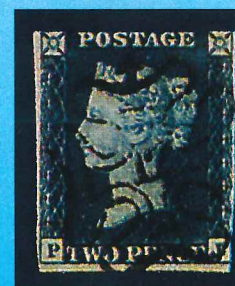
A la izquierda, el «penny black», primer sello del mundo, emitido el 6 de mayo de 1840. A la derecha, el «twopenny blues». Ambos se emitieron en Inglaterra.

retrato de la reina Victoria sobre un fondo negro, de ahí su nombre. Su matasellos fue la cruz de malta, que, a diferencia de los modernos matasellos en una esquina del sello, se aplicaba en su centro. Aunque sólo estuvo en circulación durante un año (fue sustituido por el «penny red», que circuló hasta 1880), se imprimieron varios millones y no es especialmente raro. No obstante, su importancia histórica hace que los ejemplares nuevos estén valorados en más de 500.000 pesetas y los viejos en unas 35.000.