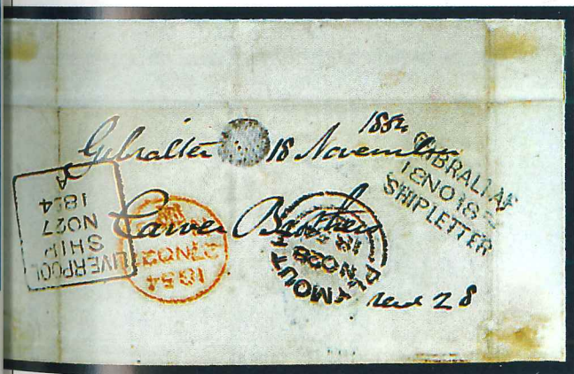
Carta de 1854 a Plymouth que posee las diferentes marcas de su recorrido: Gibraltar, Liverpool y el fechador de llegada.

retrato de la reina Victoria sobre un fondo negro, de ahí su nombre. Su matasellos fue la cruz de malta, que, a diferencia de los modernos matasellos en una esquina del sello, se aplicaba en su centro. Aunque sólo estuvo en circulación durante un año (fue sustituido por el «penny red», que circuló hasta 1880), se imprimieron varios millones y no es especialmente raro. No obstante, su importancia histórica hace que los ejemplares nuevos estén valorados en más de 500.000 pesetas y los viejos en unas 35.000.